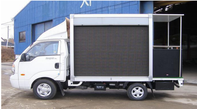
LED 선거용 차량